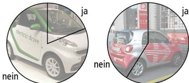
Basis: 32 Teilnehmende

teilnehmer planen in den nächsten Jahren den Kauf eines Elektroautos (Diagramm links). Die Anzahl Elektroautos wird also voraussichtlich längerfristig auch in der GISA steigen. Der Vorstand wird die Situation weiter im Auge behalten und mittelfristig Abklärungen bezüglich Anpassungen eines Teils der GISA-Parkplätze treffen.